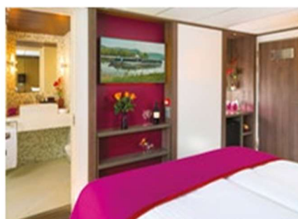
Cabine Deluxe Baie vitrée pont Supérieur

Toutes les cabines disposent de 2 lits rapprochables